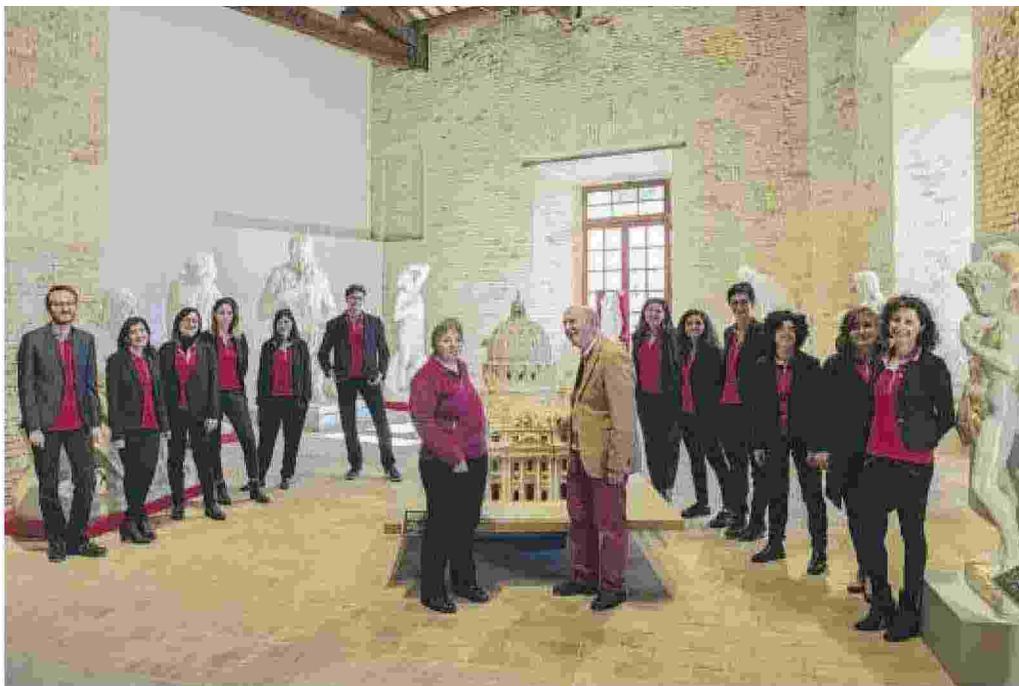
L'ARTE CONTINUA A VIVERE CON NUOVI PROGETTI SUI CANALI SOCIAL

Una nuova iniziativa si avvia in questi giorni: un'edizione straordinaria della Biennale Ar- teinsieme . All'insegna degli hashtag #biennalearteinsieme e #laculturanon dimenticanessuno, il Museo Omero inviterà i luoghi della cultura a pubblicare sui loro social materiale inerente la propria realtà che sia accessibile ai disabili. Tutti i video realizzati sono raccolti nella playlist #iorestoacasa del canale Youtube www.youtube.com/user/museotattileomero . Per restare aggiornati, basta seguire i profili social del Museo Omero .